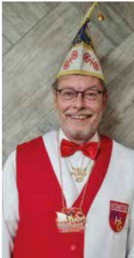
Manfred Klug Minister für friedliche Sonntage und spanische Fiesta