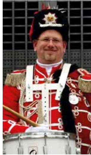
Thorsten Anstatt Minister für weiß blaue Traumreisen