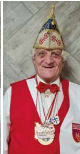
Franz-Josef Mautschka Minister für alle Höhen und Tiefen