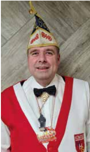
Karsten Lange Minister für Assecuranzen und politisches Gebabbel