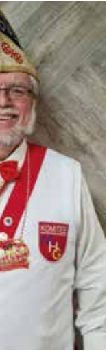
... t Kau präsident r Paarweck welsgeiger