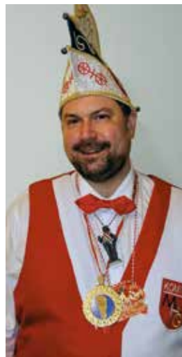
Johannes Klomann Minister für Gaddefelder und Rote Schoppe