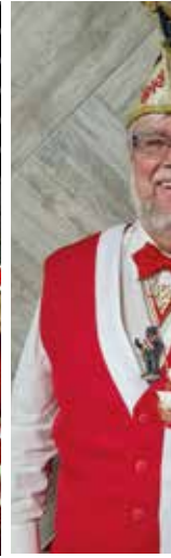
Hors Sitzungs- Minister für und Deiw